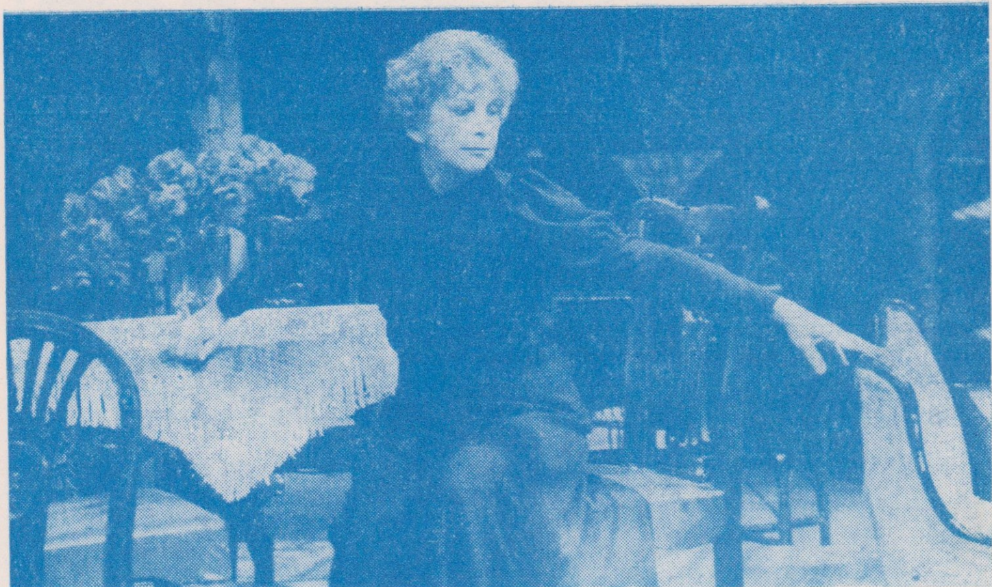
M. Gorkij: VASSA ŽELEZNOVÁ — činohra v Divadle Zd. Nejedlého