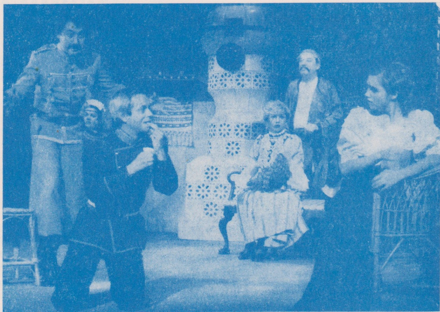
G. B. Shaw: ČOKOLÁDOVÝ HRDINA — komorní scéna činohry