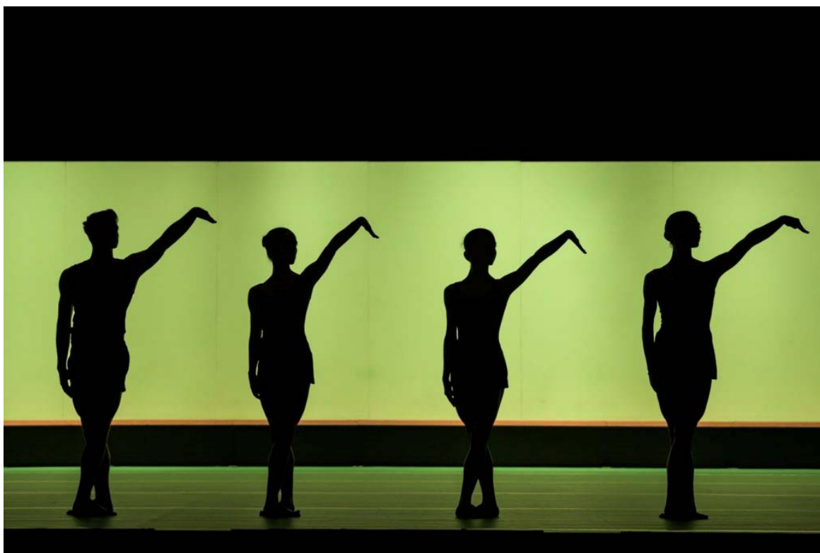
Balet Národního divadla Moravskoslezského — O. Naharin: Hora

Vytvořit něco zcela nového se zdá být v současnosti nemožným úkolem. A Naharin sám možná takovou ambici ani nemá. A nijak se za to (v tom nejlepší smyslu) nestydí. Odhaluje, přetváří a využívá to, co dávno známe. Ať už se jedná o pohyb, který jsme automaticky a beze studu dělali jako děti nebo o využití notoricky známých melodií, jejichž transformaci bez okolků zapojuje do hry. Hora čerpá energii mimo jiné i z remixu klasických skladeb. Přesně těch, ze kterých v minulosti čerpal ve své tvorbě japonský umělec a hudebník Isao Tomita , na jehož tvorbě choreografii už v roce 2009 Naharin s Batcheva Dance Company postavil. Vedle Straussov symfonické básně Tak pravil Zaratusthra klade Wagnerovu Valkýru , Star Wars Johna Williamse nebo Preludium k Faunovu odpolední