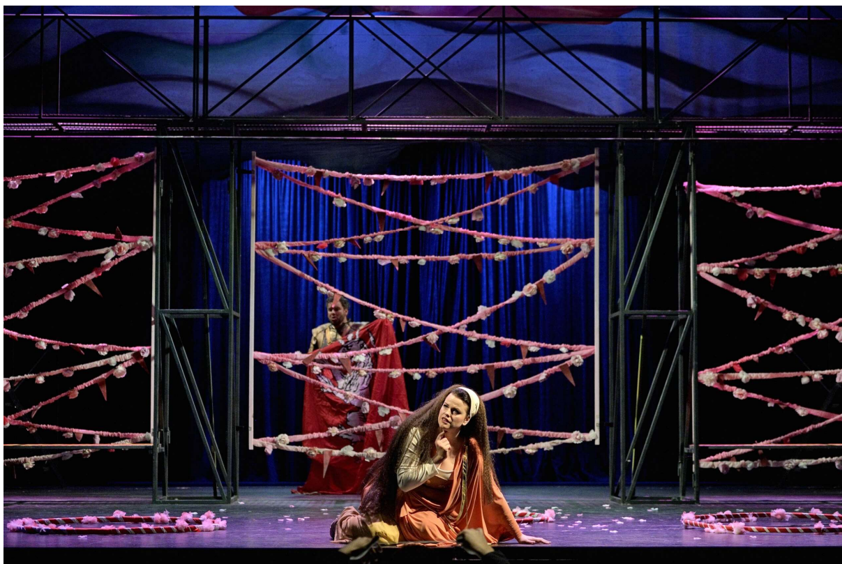
Z inscenace Braniboři v Čechách.