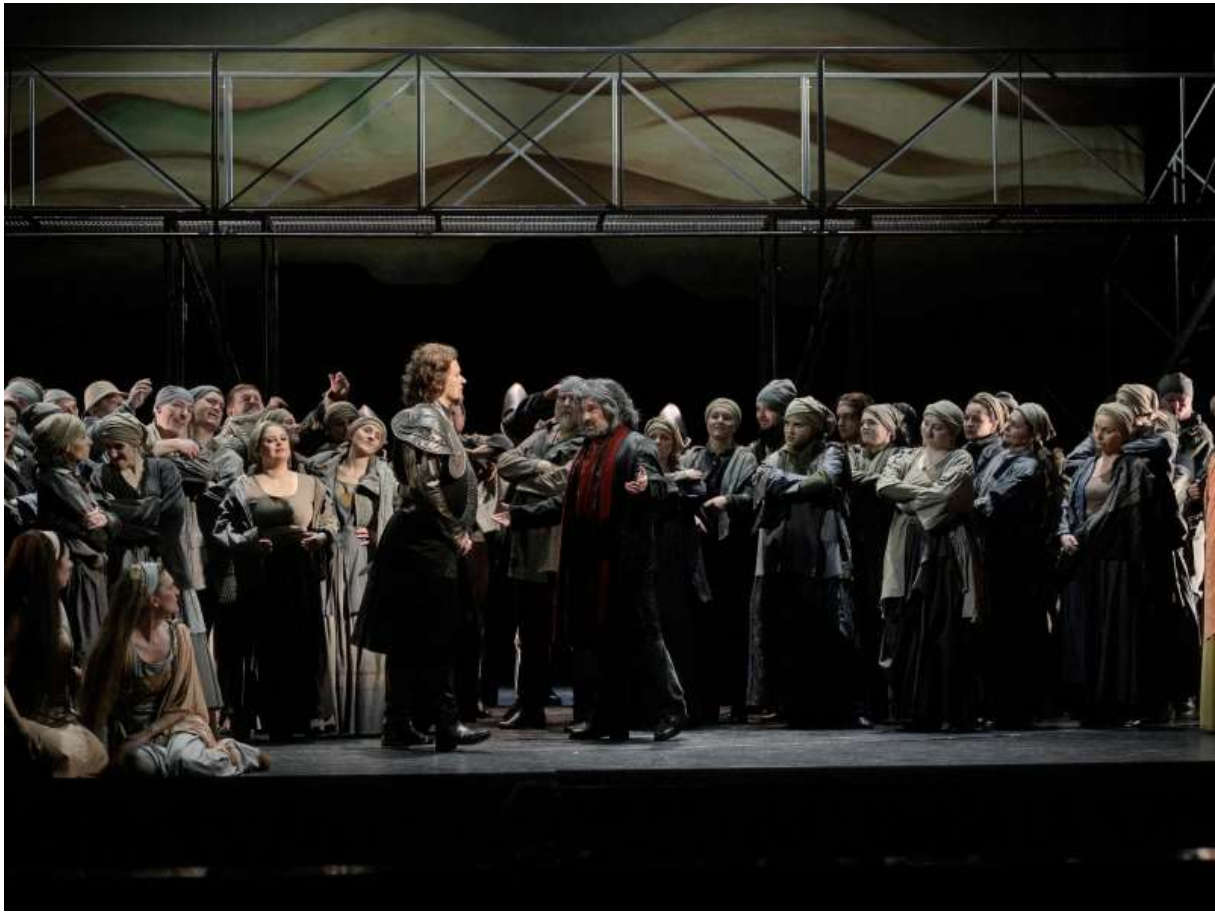
Z inscenace Braniboři v Čechách.

byl z jednoho kusu a hmoty, je dokonale synergický, ale současně umí být i těkavý a nestálý. Jako iracionální produkt davové psychologie zasahuje prudce a přímo do děje.