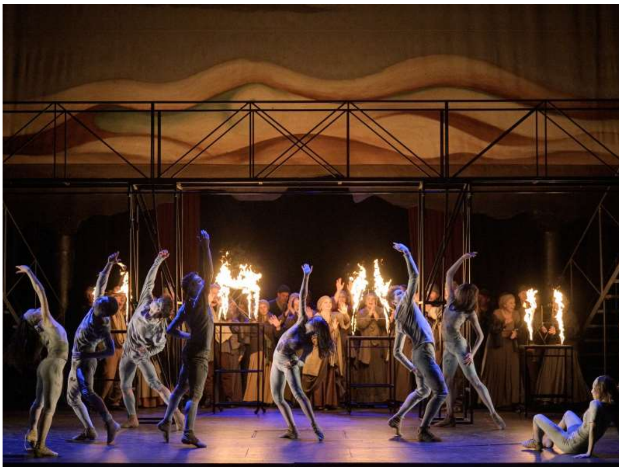
Z inscenace Braniboři v Čechách.