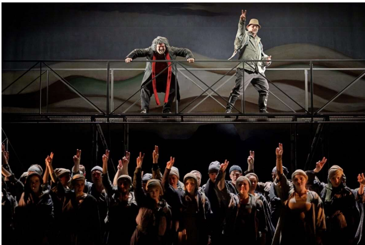
Z inscenace Braniboři v Čechách.